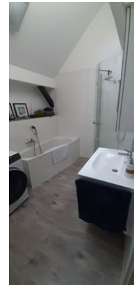
Badezimmer Ansicht 3