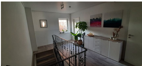
Flur Ansicht 2