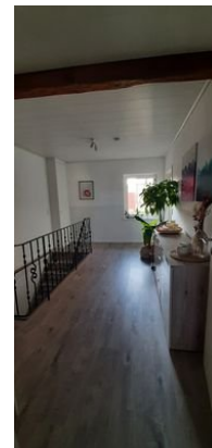
Flur Ansicht 3