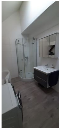
Badezimmer Ansicht 2