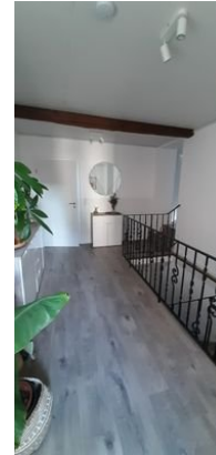
Flur Ansicht 1