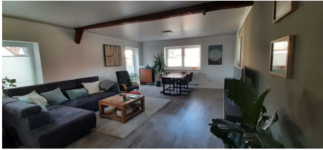
Wohnzimmer Ansicht 2