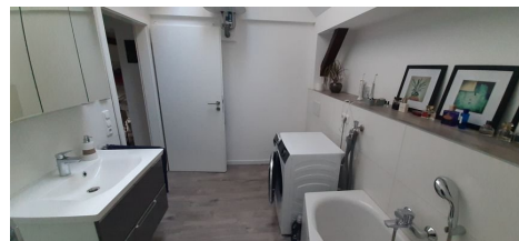
Badezimmer Ansicht 1